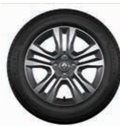
Rin de aluminio Jogger 16" diamantado