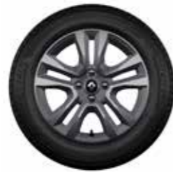
Rin de aluminio Jogger 16"