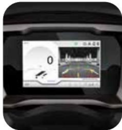
MARCHA ATRÁS Y CÁMARA TRASERO