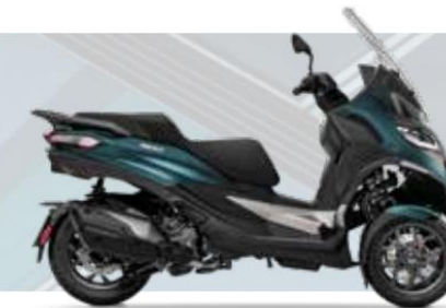
AZUL OXIGENO MATE