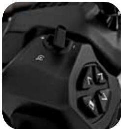
CONTROL DE CRUCERO