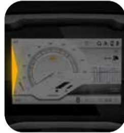
PUNTO CIEGO SISTEMA DE INFORMACION