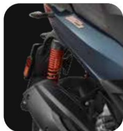
MUELLES AMORTIGUADORES ROJO