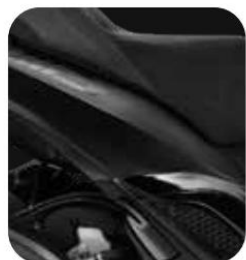
COLOR NEGRO MATE