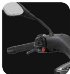
BLOQUES DE CONTROL NEGRO TOTAL