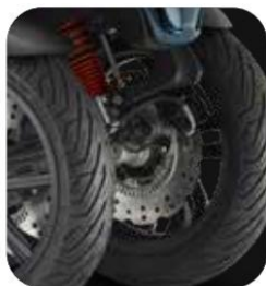
DISCOS DE FRENO LA MARGARITA