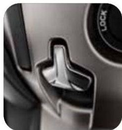
NUEVO FRENO DE ESTACIONAMIENTO