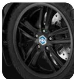
LLANTAS NEGRAS PULIDO