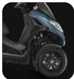
DISEÑO GT COMPACTO