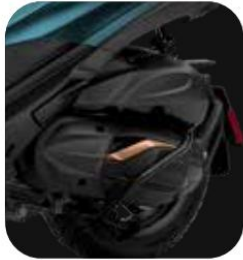
MOTOR NUEVO DESDE 530 CC EURO 5