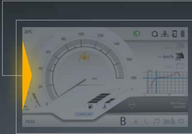
BLIS - SISTEMA DE INFORMACIÓN DE PUNTO CIEGO (SOLO SU MP3 530 HPE)