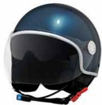
CASCO ESPEJO BLUETOOTH