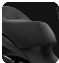
SELLA TOTAL NEGRO