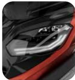
NUEVOS FAROS LED DRL