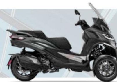
GRIS TITANIO MATE