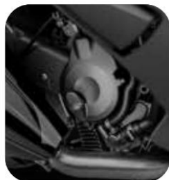
MOTOR DESDE 400 CC EURO 5