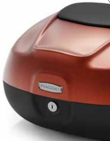
MALETÍN SUPERIOR 37 l