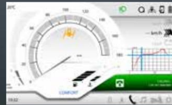
CONECTIVIDAD CON SMARTPHONE (SOLO SU MP3 530 HPE E MP3 400 S)