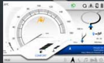
SISTEMA DE NAVEGACIÓN (SOLO SU MP3 530 HPE E MP3 400 S)