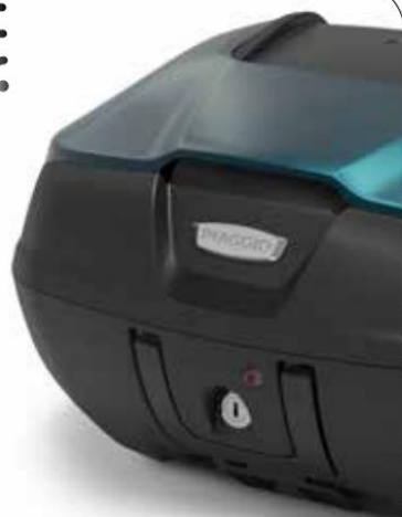
MALETÍN SUPERIOR 52 l