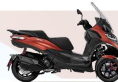
ARANCIO ATARDECER MATE