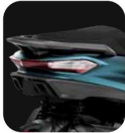
NUEVO DISEÑO DE LÍNEAS ULTRAMODERNAS