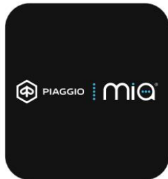
CONECTIVIDAD AVANZADA CON PIAGGIO MIA A BORDO