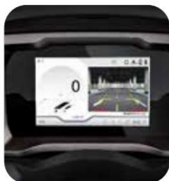
EQUIPO CON DISPLAY DIGITAL TFT DE 7"