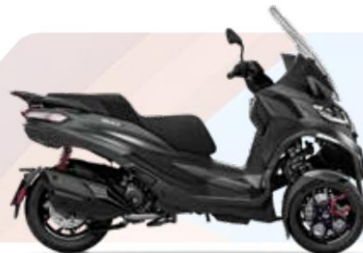
GRIS TITANIO MATE