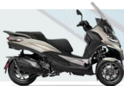
GRIGIO NUBE MATE