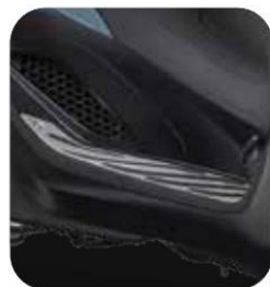
CUBIERTAS DE ESTRIBERAS METÁLICO