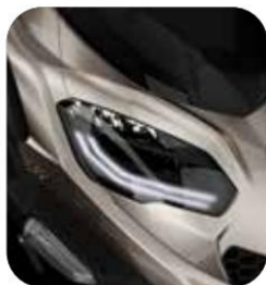
SISTEMA DE ILUMINACIÓN COMPLETA LED