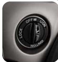
NUEVO SISTEMA SIN LLAVE