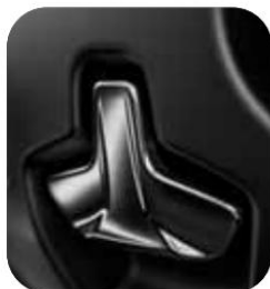
NUEVO FRENO DE ESTACIONAMIENTO