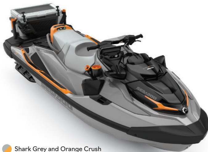
Shark Grey and Orange Crush