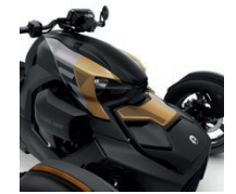
Fiebre del oro